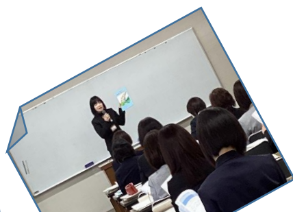
四日市市立幼稚園こども園保育園