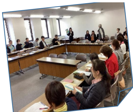
四日市私立保育園連盟 園長会でのカリキュラム紹介